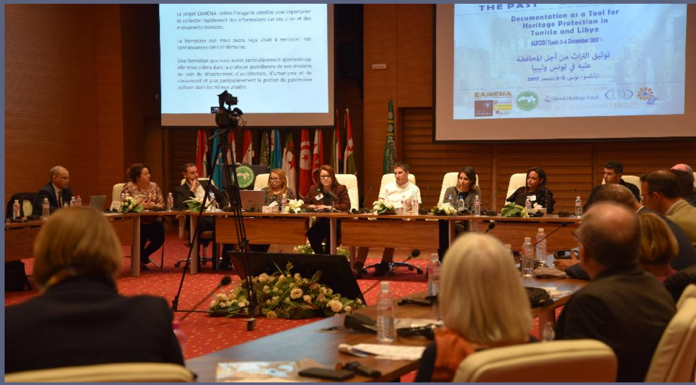
Above: EAMENA members participate in the "Protecting the Past" conference.