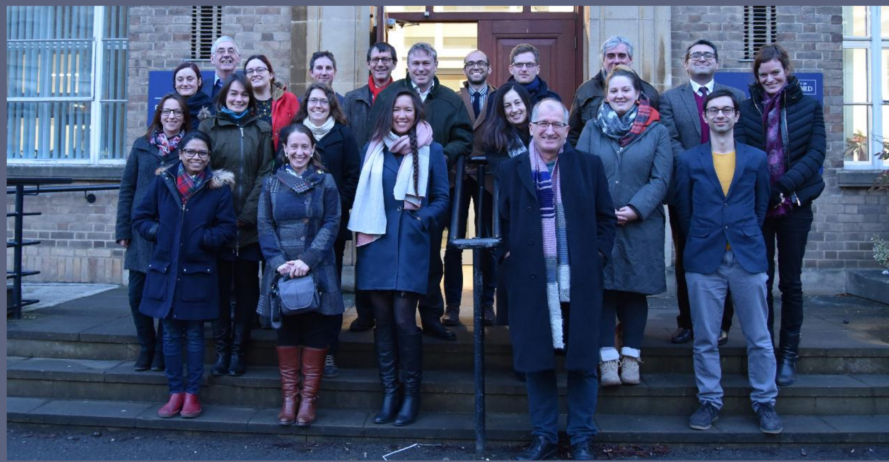
Above: The EAMENA team in 2017.