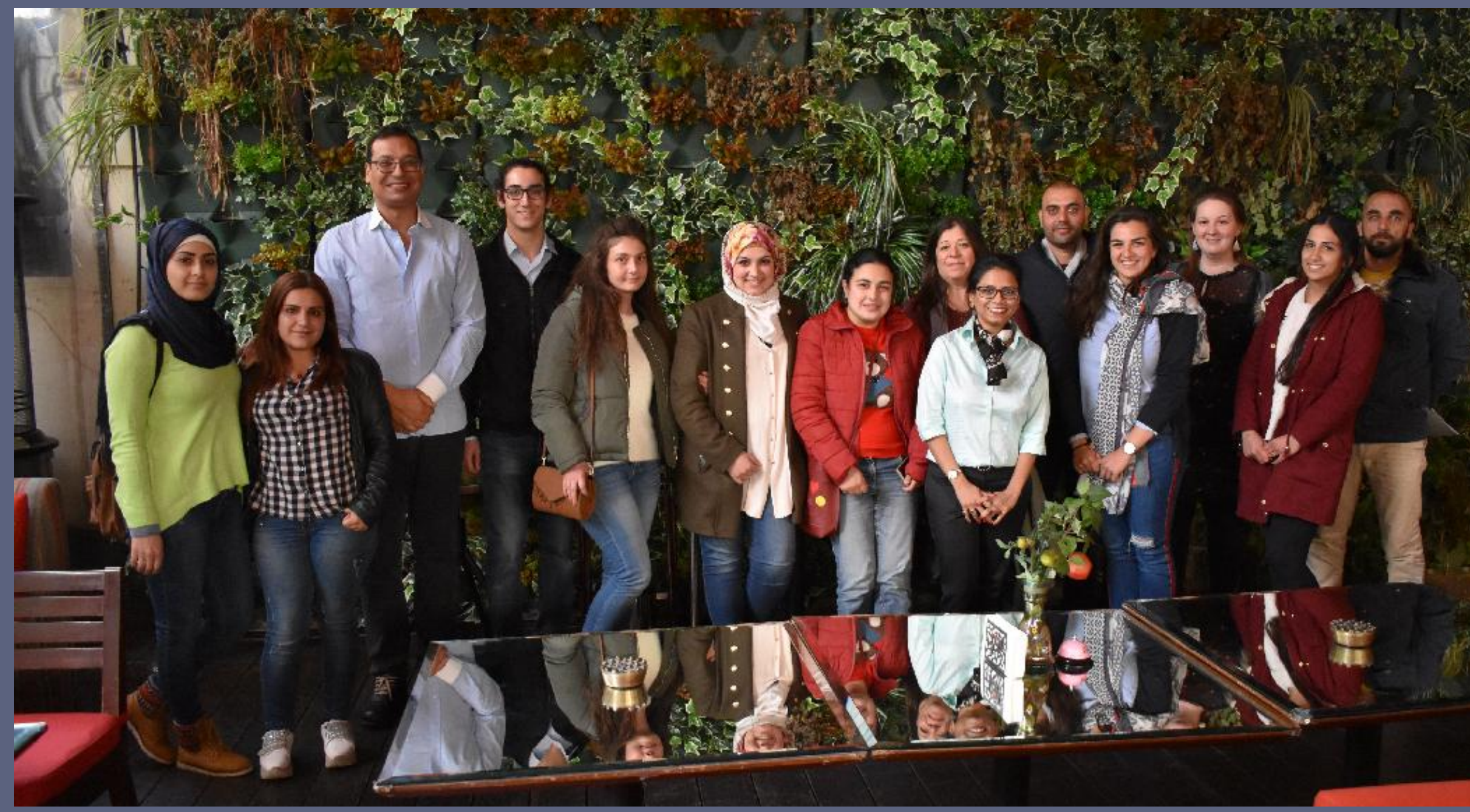
Above: Training participants with EAMENA trainers during the second workshop in Lebanon, Beirut 2019.