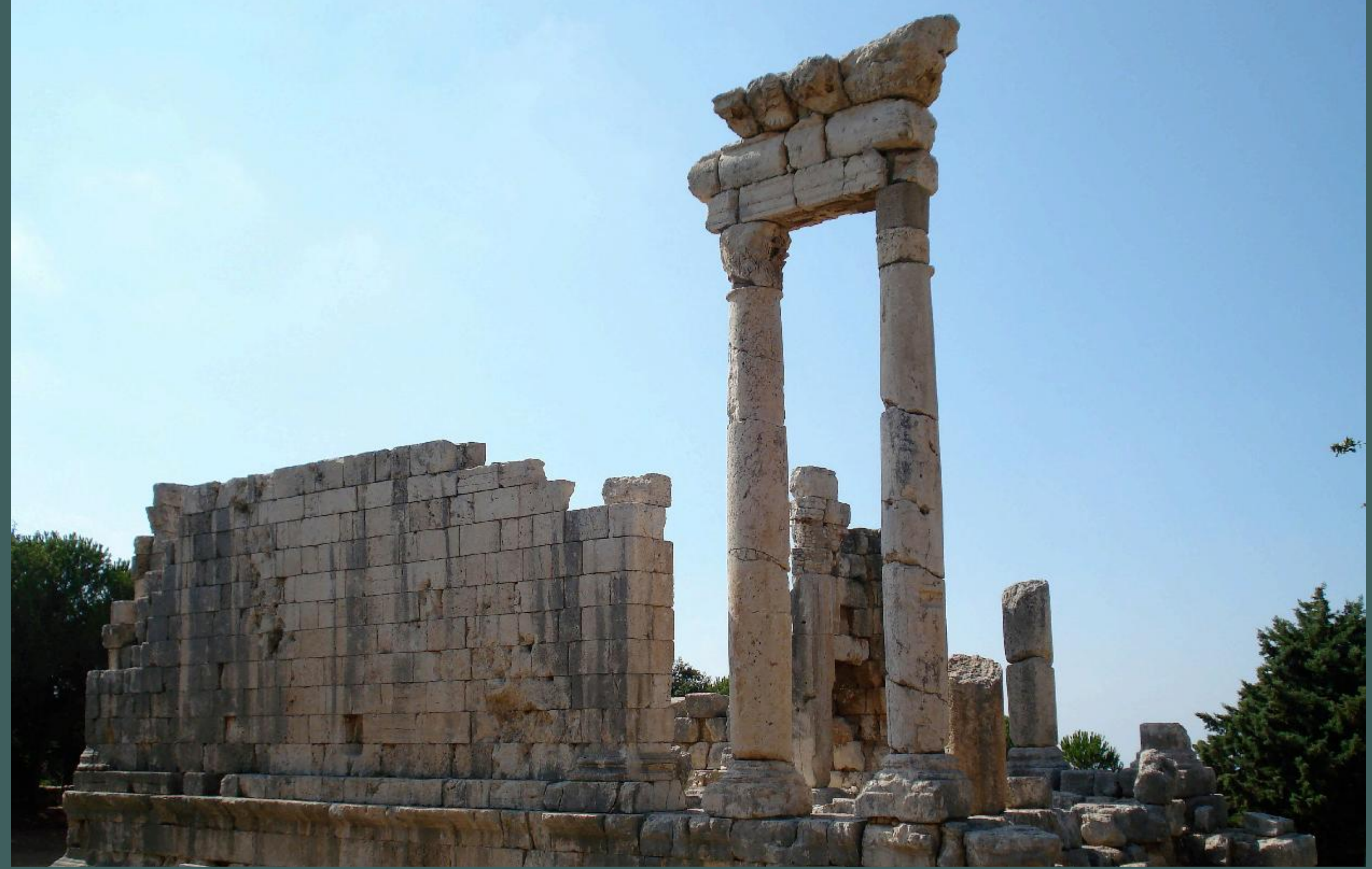
Above: Ain Aakrine Roman Temple.