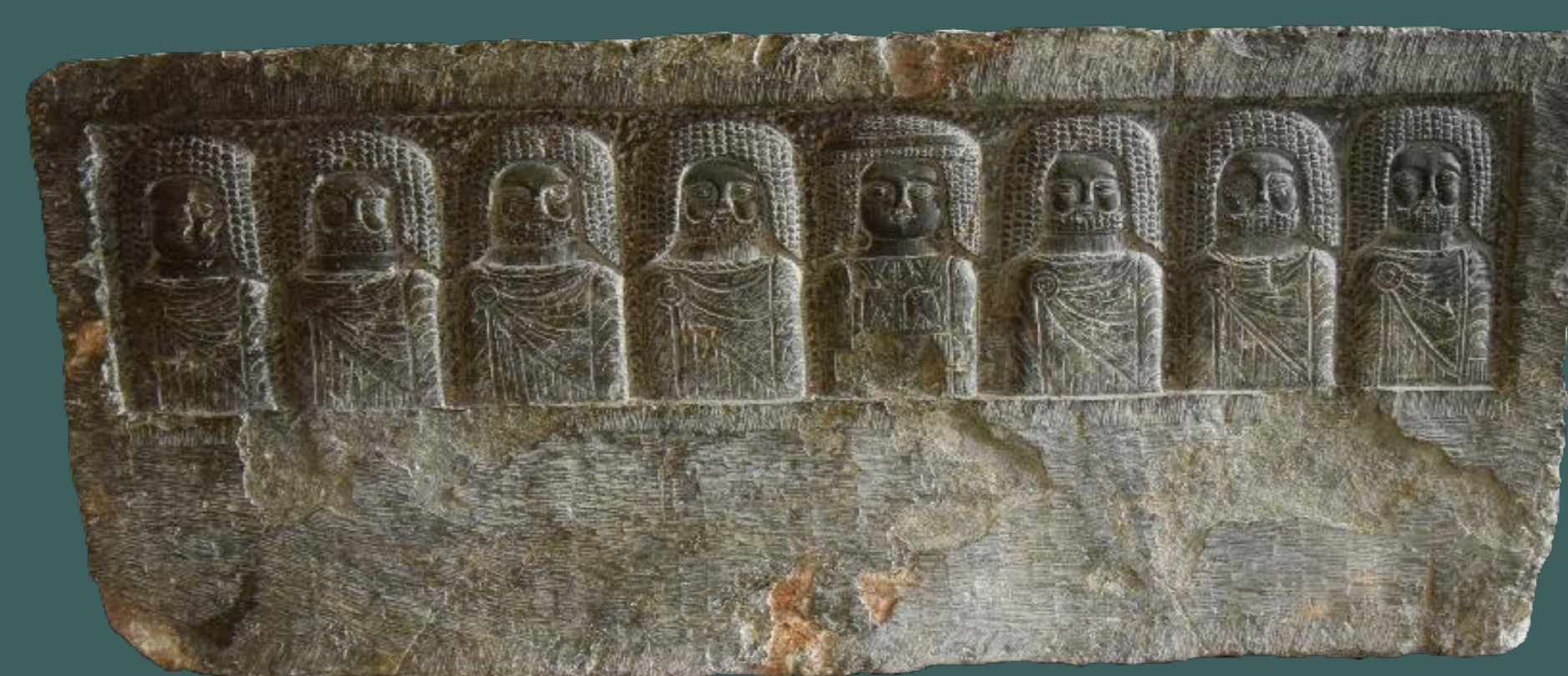
Ci-dessus : Stèle représentant huit dieux numides, Musée national du Bardo (Photographie : N. Sheldrick).

أرضية فسيفساء تحمل صورة إيليس وعرائس البحر، المتحف الوطني بباردو (تصوير: د. جارفيش).